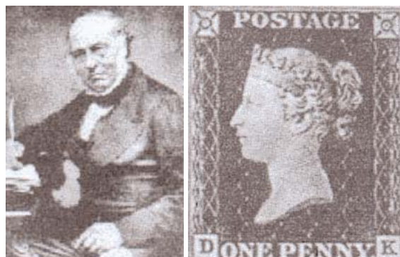
Sir Rowland Hill et le premier timbre

Pour toi et moi, c'est facile, on a l'embarras du choix pour correspondre; le téléphone, le télégramme, la lettre à la poste, le courriel (enfants@ paindepice.org) et le tour est joué. Ce dernier, tu l'utilises souvent et j'en sais quelque chose.